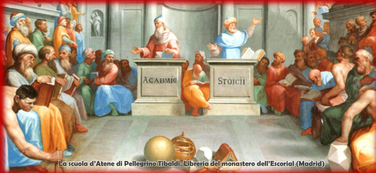
La scuola d'Atene di Pellegrino Tibaldi, Libreria del monastero dell'Escorial (Madrid)